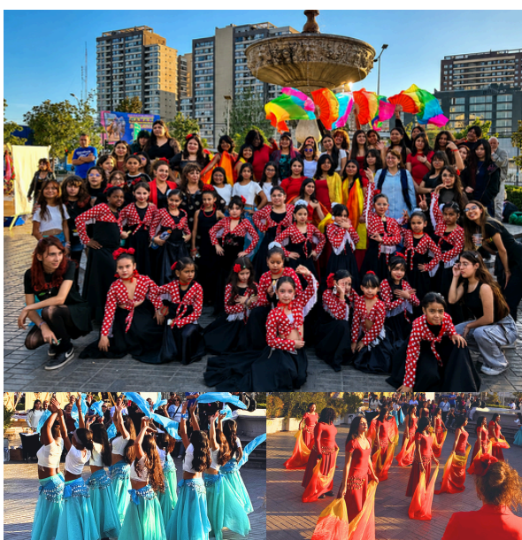
Día de la Danza

Durante la actividad, estudiantes protagonizaron diversas presentaciones de danza, demostrando su talento, compromiso y creatividad, y poniendo en valor el arte como herramienta de formación integral. Esta iniciativa permitió visibilizar el trabajo artístico del establecimiento y fortalecer el vínculo con la comunidad.